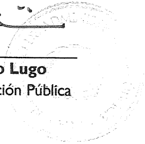
Lic. Darío Castillo Lugo Ministro de Administración Pública

Refrendada por el Ministerio de Administración Pública (MAP):