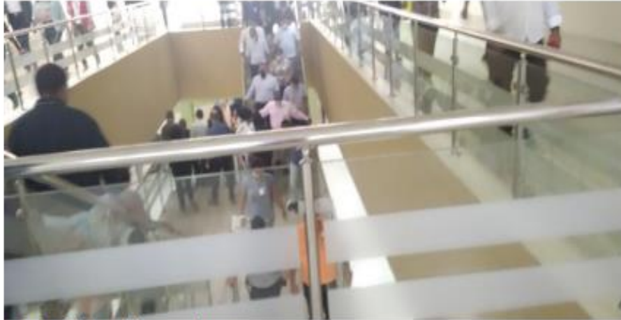
Personal bajando las escaleras.