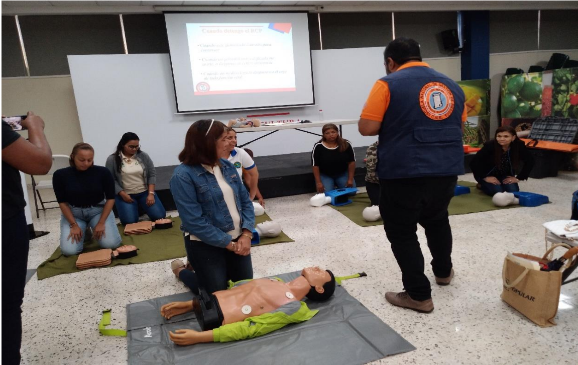
Foto: Participantes en el curso reciben prácticas.

Definir los conceptos sobre Reanimación Cardio Pulmonar, así como ponerlo en práctica.