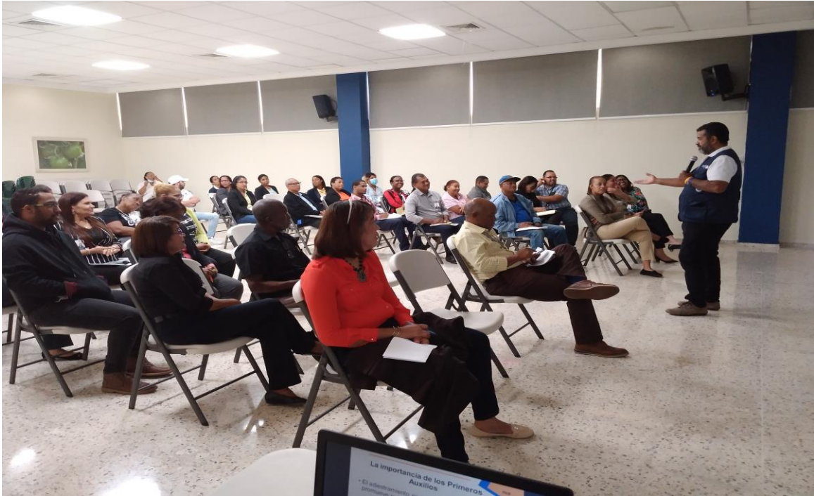
Foto: Participantes en el curso.