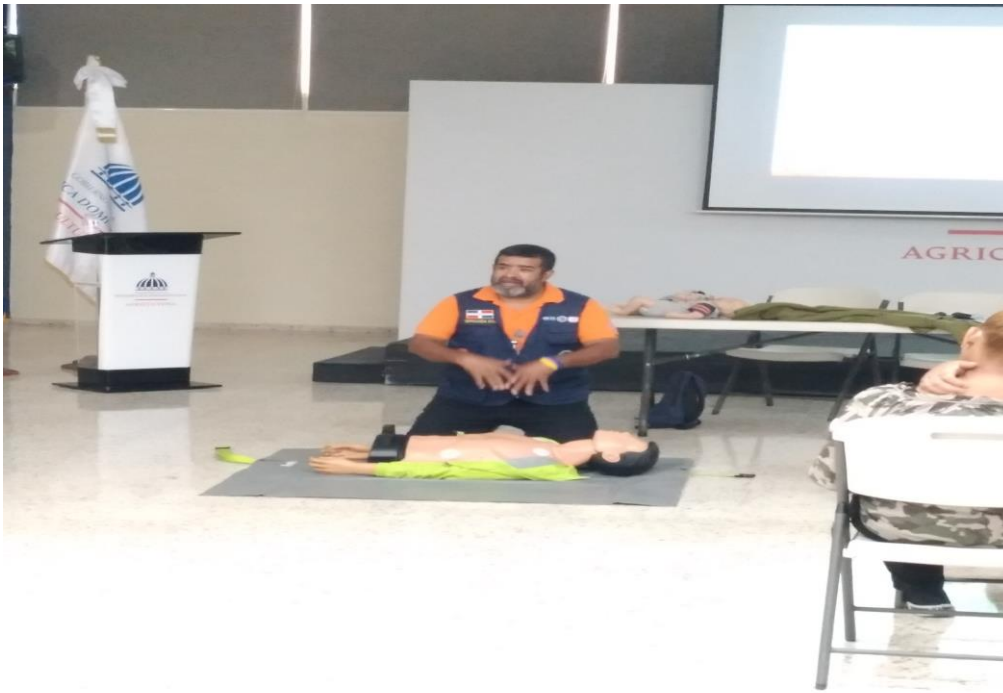
Foto instructor haciendo las explicaciones.

Reconocer los tipos de vendajes, sus usos y aplicaciones en cada uno de los casos que se pueda presentar. Evaluación practica de las habilidades adquiridas por los participantes al momento de implementar cada uno de los diferentes vendajes.