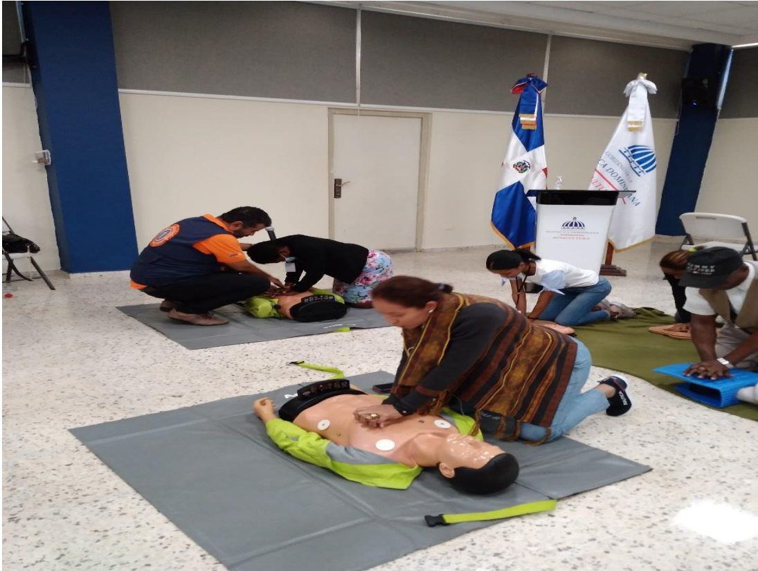
Foto: Participantes en el curso reciben prácticas.

Conocer los tipos de levantamiento para traslado de paciente con camilla como con objetos cotidianos, garantizando la seguridad durante el traslado en óptimas condiciones del paciente, entre otros aspectos de interés para los participantes.