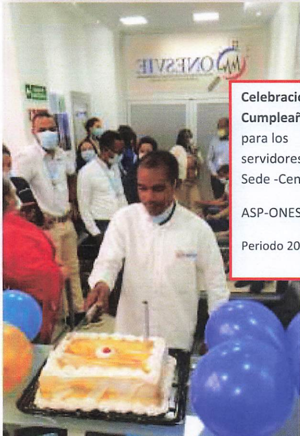
Celebración de Cumpleaños, para los servidores de la Sede -Central. ASP-ONESVIE Periodo 2020-22