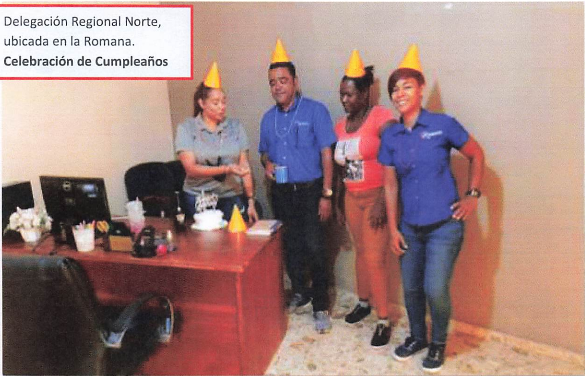
Delegación Regional Norte, ubicada en la Romana. Celebración de Cumpleaños