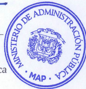
Lic. Darío Castillo Lugo Ministro de Administración Pública

Refrendada el Ministerio de Administración Pública (MAP)