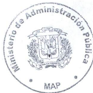
Lic. Ramón Ventura Camejo Ministro de Administración Pública

Refrendada por el Ministerio de Administración Pública