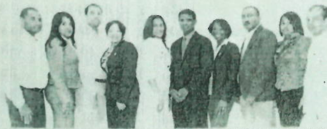
Directivos de la Asociación de Servidores Públicos del MINERD (ASP-MINERD).

La Asociación de Servidores Públicos del Ministerio de Educación (ASP-MINERD) asumió el compromiso, desde que fue constituida el 9 de diciembre del 2012, y registrada por el Ministerio de Administración Pública (MAP), de defender y proteger los derechos que la ley y los reglamentos reconocen a los empleados públicos de la institución.