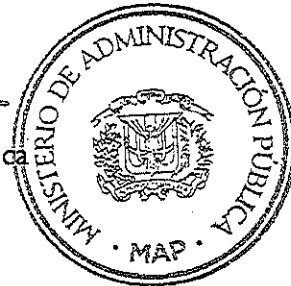
Darío Castillo Lugo Ministro de Administración Pública

En Santo Domingo, Distrito Nacional, Capital de la República Dominicana, al décimo quinto (15) día, del mes de marzo, del año dos mil veintidos (2022).