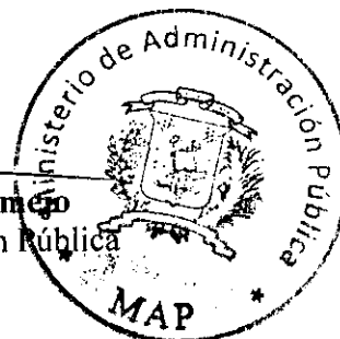
Lic. Ramón Ventura Camejo Ministro de Administración Pública