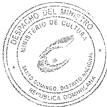
Arq. Eduardo Seiman Ministro de Cultura

Refrendado por el Ministerio de Administración Pública