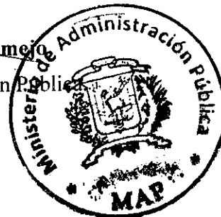
Lic. Ramón Ventura Camejo Ministro de Administración Pública

DADA: En la ciudad de Santo Domingo, Distrito Nacional, República Dominicana, a los veinticinco (25) días del mes de Febrero del año dos mil trece (2013).