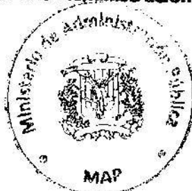
Lic. Ramón Ventura Camejo Ministro de Administración Pública

Refrendada por Ministerio de Administración Pública