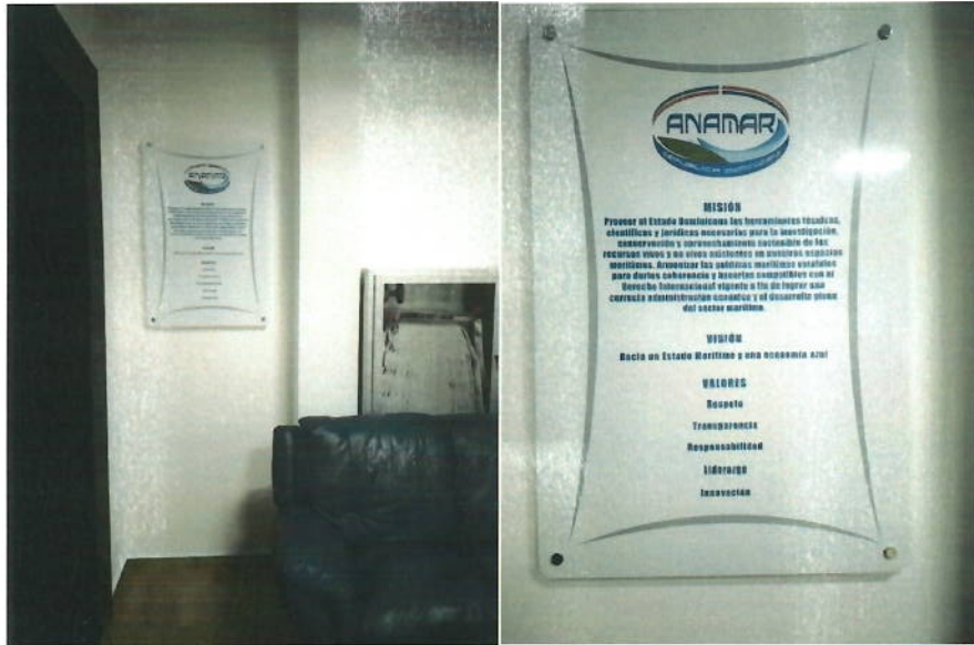
Evidencia de cuadro relativo a la Misión, Visión y Valores de la ANAMAR en las oficinas de la institución