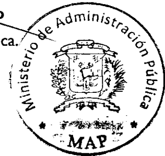
Lic. Ramón Ventura Camejo Ministro de Administración Pública.

DADA: En la ciudad de Santo Domingo, Distrito Nacional, República Dominicana, a los dos (02) días del mes de Septiembre del año dos mil trece (2013).