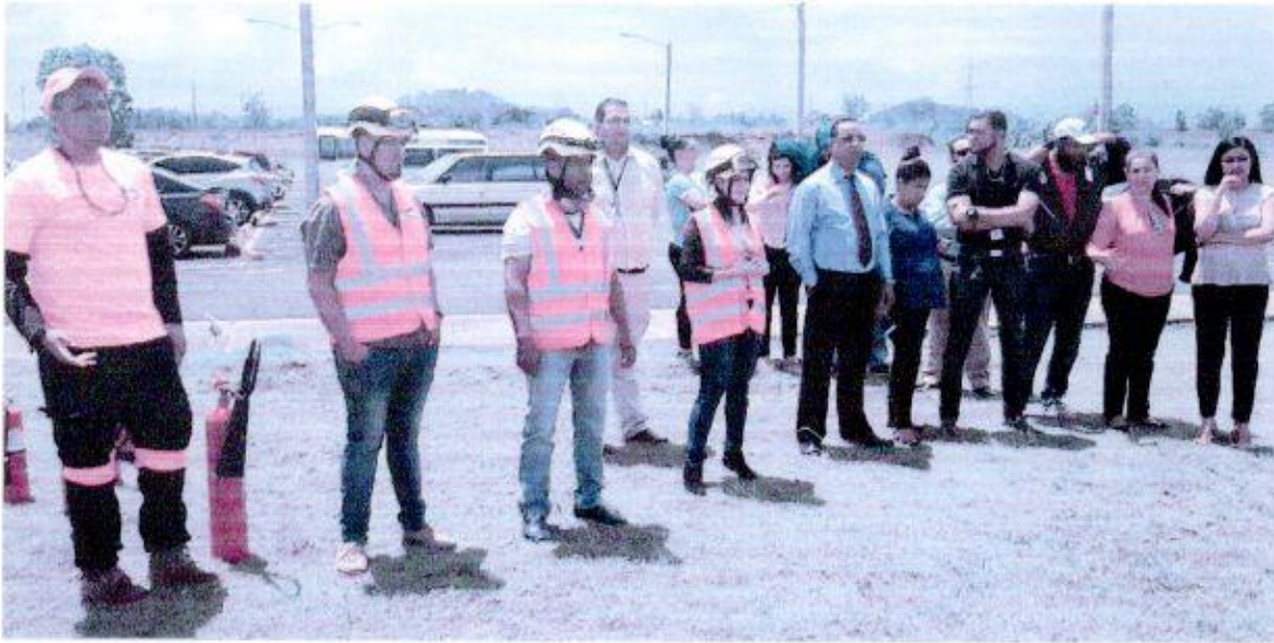
Participantes recibiendo las instrucciones por parte de los miembros de la Defensa Civil para realizar la parte práctica de la capacitación de extinción de incendios.