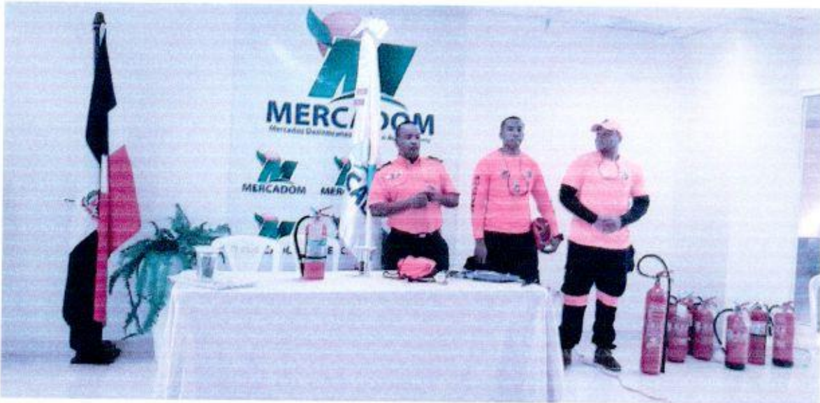
Miembros de la Defensa Civil Impartiendo la parte teórica de la capacitación de extinción de incendios.

De esta manera Mercados Dominicanos de Abasto Agropecuario (MERCADOM) y Merca Santo Domingo, culminan de manera exitosa, el ciclo de capacitaciones impartidas por la Defensa Civil a los colaboradores de la institución, quedando pendiente el Simulacro de Evacuación, todo esto en el marco de la implementación del Sistema de Seguridad y Salud en la Administración Pública (SISTAP).