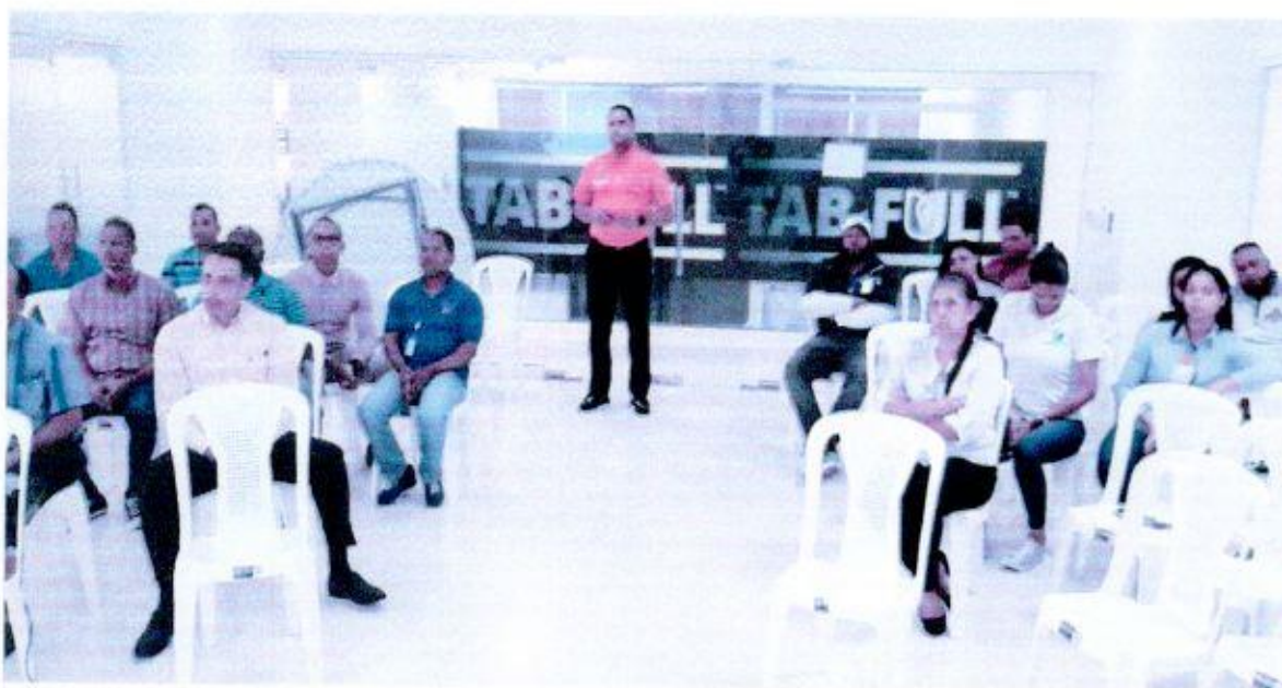
Parte de los colaboradores participantes de la capacitación en evacuación de emergencia.