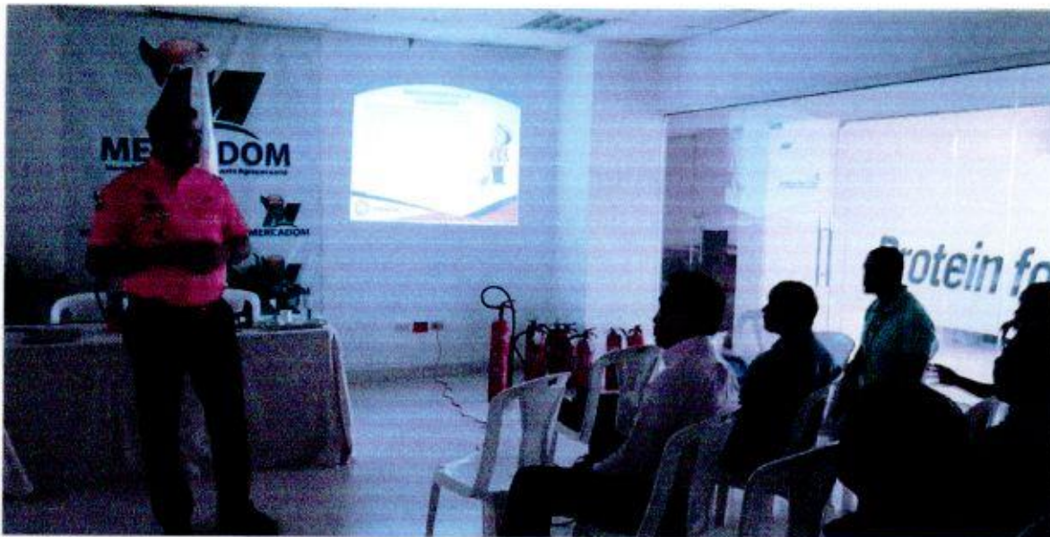
Miembros de la Defensa Civil impartiendo la capacitación de evacuación de emergencia.