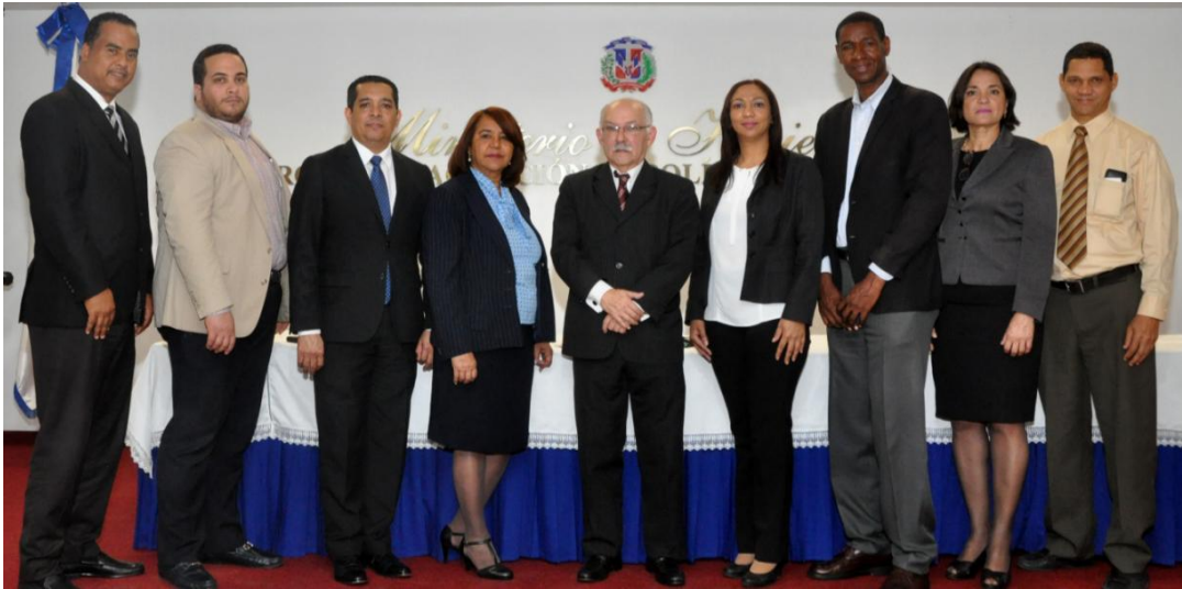
Comisión de Ética del Ministerio de Hacienda