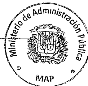
Ramón Ventura Camejo Ministro de Administración Pública

Refrendada por el Ministerio de Administración Pública;