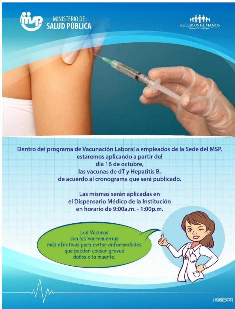
Campaña alusiva al programa de vacunación laboral a empleados del Ministerio de Salud Pública

El Ministerio de Salud Pública cuenta con un Dispensario Médico de Primeros Auxilios, garantizando la atención a todos los servidores públicos y visitantes que acuden a la institución, en este brindan las consultas de medicina general, programas preventivos de salud y atención de Emergencias, vinculando trabajo-salud y se suministran medicamentos de emergencias, bajo las normas de la Dirección General de Habilitación y Acreditación de este Ministerio.