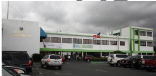
PLAN DE RESPUESTA A EMERGENCIAS EN EDIFICIO "SEDE"