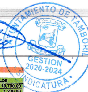
RELACION DE COMPRAS MES DE SEPTIEMBRE 2023