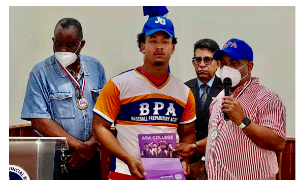
Entrega de becas a deportistas barahoneros.

entregados a las autoridades presentes, la academia donó útiles deportivos y becas a los atletas de la provincia para que viajen a los Estados Unidos a continuar con sus entrenamientos y estudios.