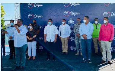
Jornada de inclusión social del Plan Quisqueya Digna, celebrada en el sector Cristo Rey del municipio de Barahona.