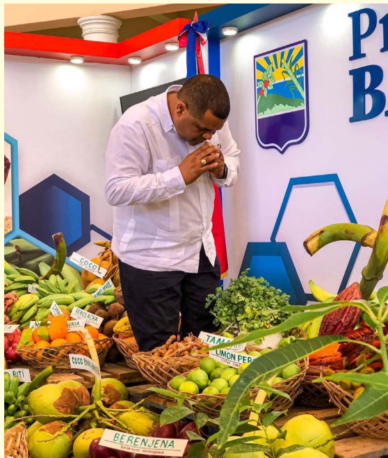
Primera feria agropecuaria celebrada en el sur del país, Barahona

Los Premios de Oro es un evento que reconoce el arte y la cultura de la Región Enriquillo donde contó con el patrocinio de La Alcaldía de Barahona, valorando su gran aporte al reconocimiento de figuras destacadas.