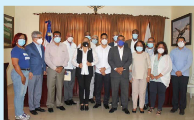
Juramentación del Consejo Económico y Social del Municipio de Barahona.