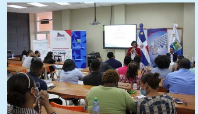
Alcaldía de Barahona junto a la Liga Municipal Dominicana, Cámara de Cuentas y FUNDESI capacitan jóvenes de la región.