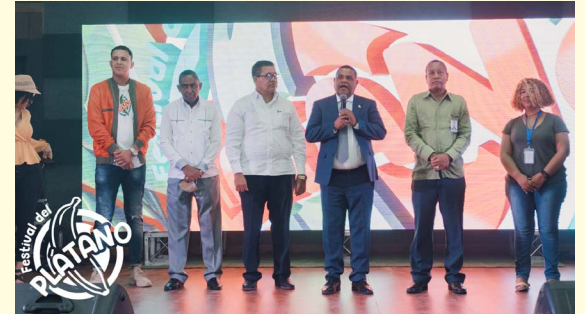
Primer Festival del Plátano Barahona, 2021