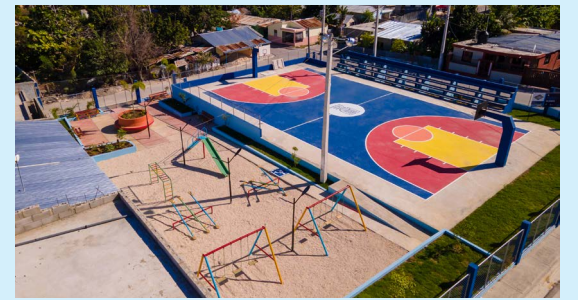
Cancha y Parque Infantil Palmarito