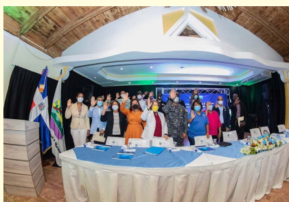
Juramentación de la Mesa Local de Seguridad Ciudadana