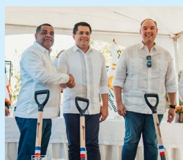
Ministro de Turismo inicia trabajos Playa Saladilla. P.7