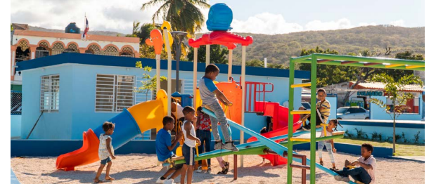
Cancha, parque infantil y escuela de música, sector Savica