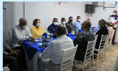
Alcaldía de Barahona realiza encuentro con autoridades para mejorar condiciones de la estructura en la Cárcel Pública.