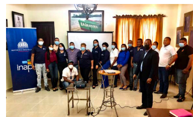
Jornada de capacitación por el Instituto de Adm. Pública