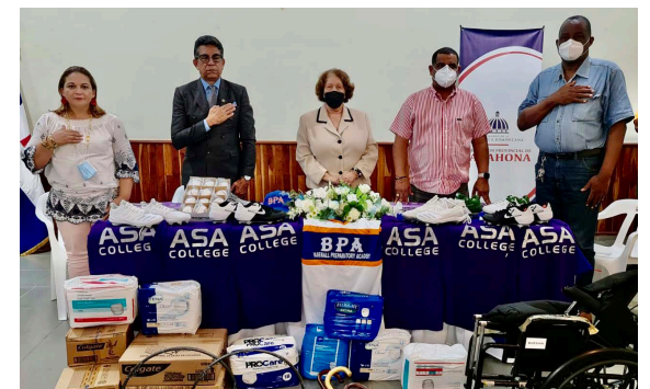
Autoridades en la mesa de honor en el reconocimiento y donación de equipos a la Gobernación y Alcaldía de Barahona.