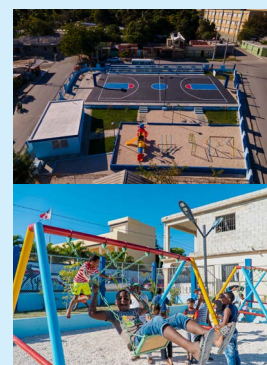
Alcaldía inaugura Parques Infantiles, Escuela de Música y remodela canchas en sectores. P.8

El ministro de Turismo, David Collado, dio el primer palazo para dejar iniciados los trabajos de reconstrucción de la vía de acceso a la Playa Saladillas, a fin de conectar el Malecón con la Playa.