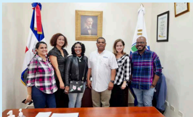
Alcaldía de Barahona recibe programa Triángulos Culturales, Proyecto Transformando Vidas con Colores.