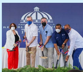
Presidente Luis Abinader inaugura obras en Barahona.

La alcaldía de Barahona, a través de la gestión de del Alcalde Míctor Fernández, dona 2,500 metros para la construcción de 40 viviendas en el sector Don Bosco. P.4