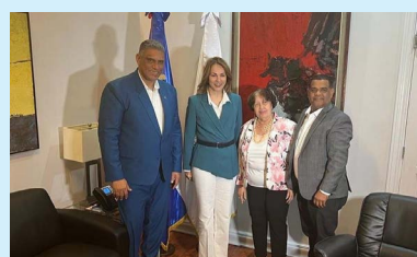
Autoridades de Barahona junto al ministro Jesús Vásquez visitan Ministra de Cultura en solicitud Esc. de Bellas Artes y oficina de patrimonio cultural.