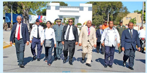
Conmemoración del 209 aniversario del natalicio de Juan Pablo Duarte y Diez.