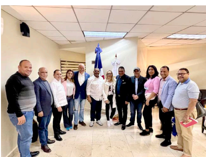
Delegación de Alcaldes y Alcaldesas de la República Dominicana, junto a directivos de las empresas españolas.

En una entrevista exclusiva en el programa radial Acción Mañanera de Empresas Radiofónicas, donde explicó los detalles de las obras iniciadas en los diferentes sectores, proyectos en ejecución y anunció la remodelación y remozamiento del Mercado Público.