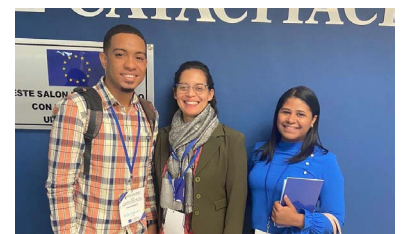
Capacitación Planificación Municipal para el desarrollo Inclusivo y Sostenible

La Alcaldía de Barahona ha iniciado la capacitación de todo su personal administrativo mediante una jornada de cursos-talleres impartidos por el Instituto Nacional de Administración Pública. A través del departamento de Recursos Humanos del Ayuntamiento se realizó la capacitación de los empleados, cuya primera etapa dada en dos semanas, abarcó los temas de inducción a la administración pública, servicio y atención al ciudadano, trabajo en equipo y manejo de conflictos.