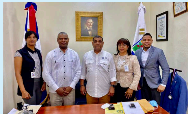
Alcaldía de Barahona e INFOTEP se reúnen para coordinar acciones de formación a Jóvenes en el municipio.