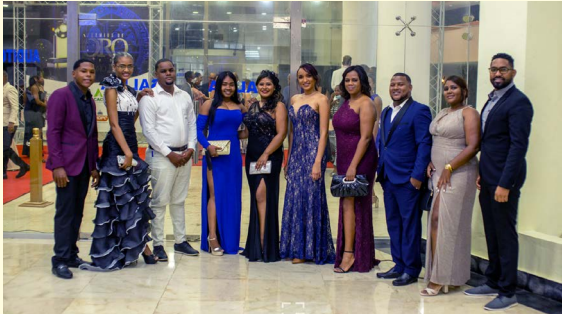
XVIII gala de los Premios de Oro Barahona, 2021 de esta ciudad

Los Premios de Oro es un evento que reconoce el arte y la cultura de la Región Enriquillo donde contó con el patrocinio de La Alcaldía de Barahona, valorando su gran aporte al reconocimiento de figuras destacadas.