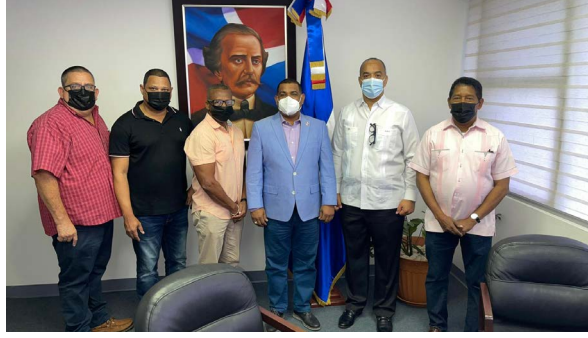
Personal del consulado Dominicano en Puerto Rico.