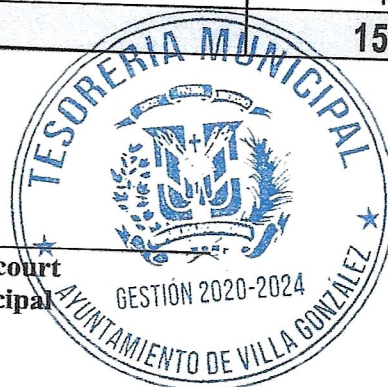
Prospero Betancourt Tesorero Municipal