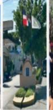
BULEVAR DE LA SANCHEZ