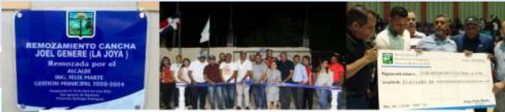
Remozamiento Cancha Joel Genere (La Joya)