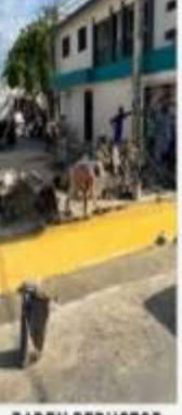
BADEN REDUCTOR DE VELOCIDAD, C/ JOSE MARTE