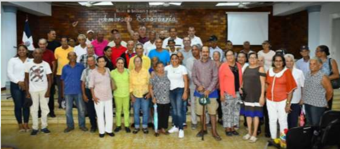
Entrega De 120 Pensiones Solidarias A Envejecientes