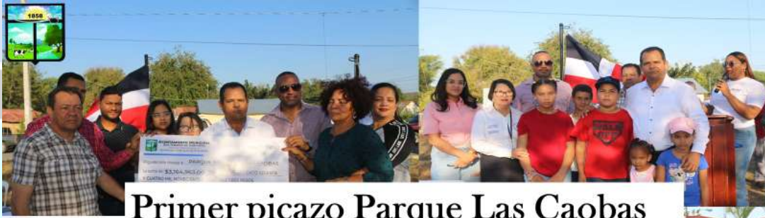
Primer picazo Parque Las Caobas