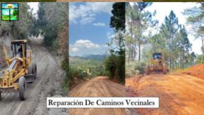
Reparación De Caminos Vecinales