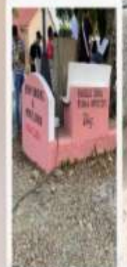
PARQUE AGUA CLARA, MONTE LLANO