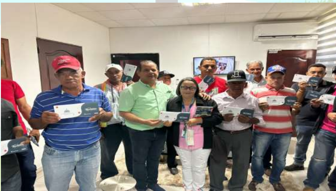
Entrega De Bonos Navideños