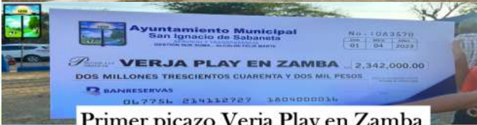
Primer picazo Verja Play en Zamba