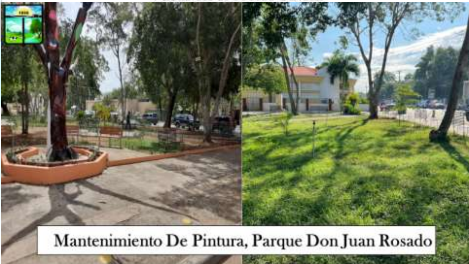
Mantenimiento De Pintura, Parque Don Juan Rosado