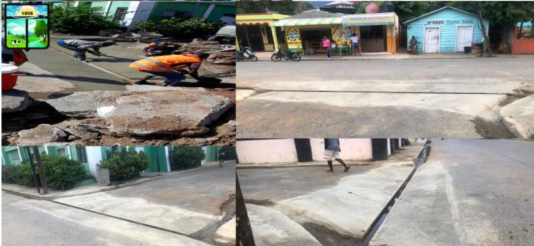
Construcción De Baden, C/ Sánchez Frente Al Polideportivo