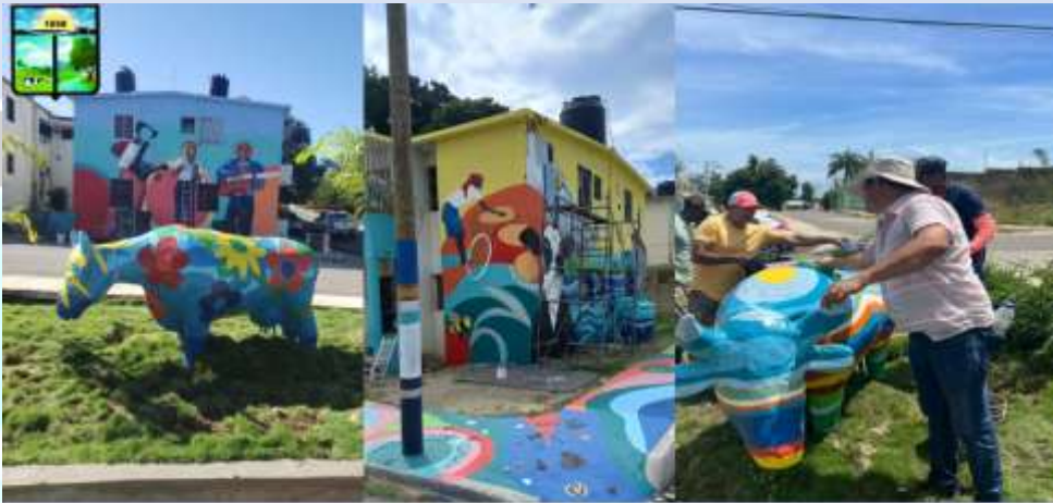
Remozamiento Bulevar, Pintura a Murales mas Colocación de Vacas en el sector Sávida