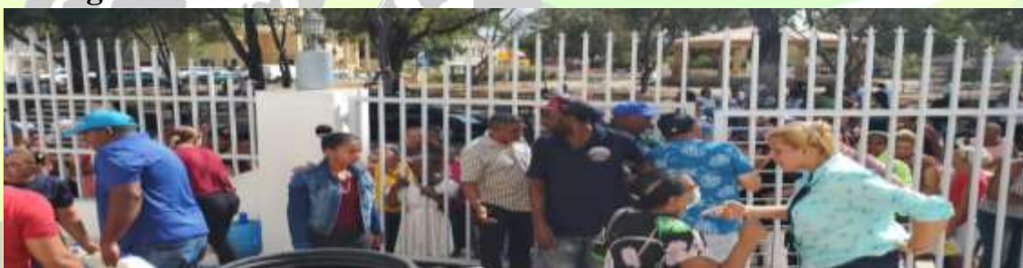
Entrega De 9 Mil Litros De Leche Para La Semana Santa