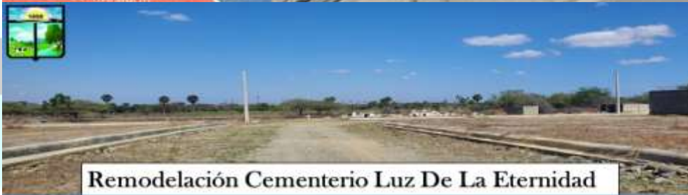
Remodelación Cementerio Luz De La Eternidad