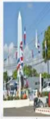
REMEDIACIÓN MONUMENTO A LOS HÉROES DE LA RESTAURACIÓN