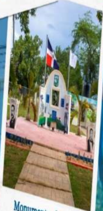
Monumento al General Santiago Rodríguez