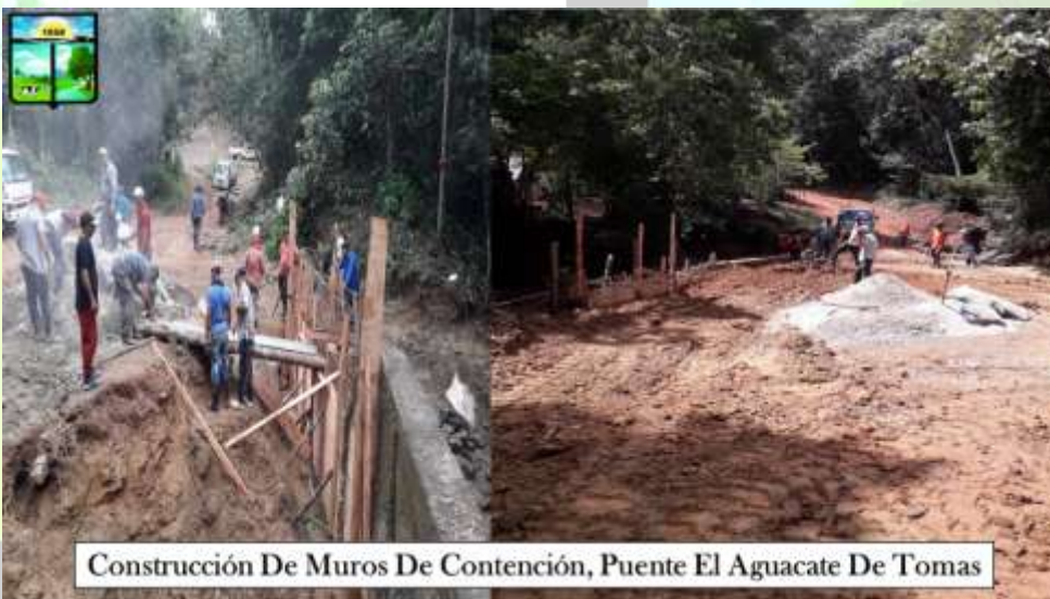
Construcción De Muros De Contención, Puente El Aguacate De Tomas