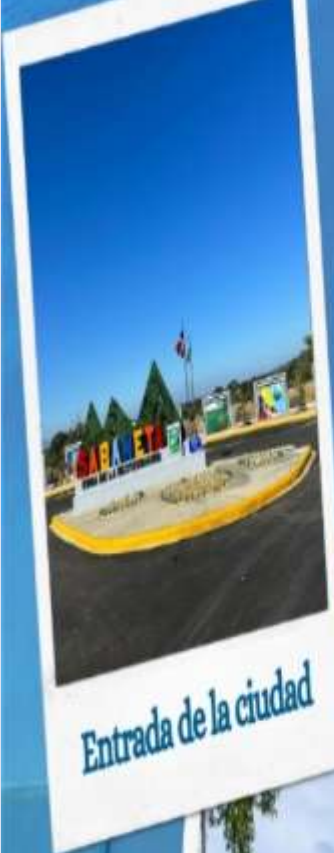
Entrada de la ciudad