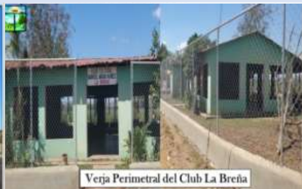
Verja Perimetral del Club La Breña