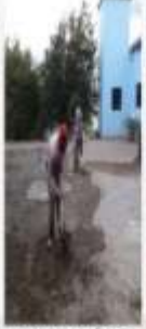
CONSTRUCCIÓN DE CALZADAS Y PISO, P. LAS MERCEDES