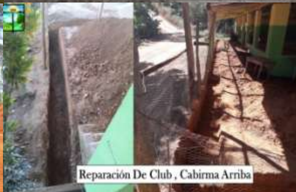
Reparación De Club , Cabirma Arriba