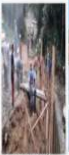
CONSTRUCCIÓN MURO DE CONTENCIÓN