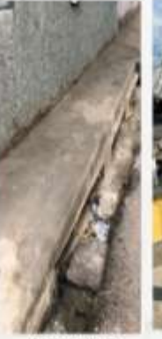
CANALETA E IMBORNALES