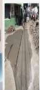
CONSTRUCCIÓN DE MÁS DE 85 BADENES