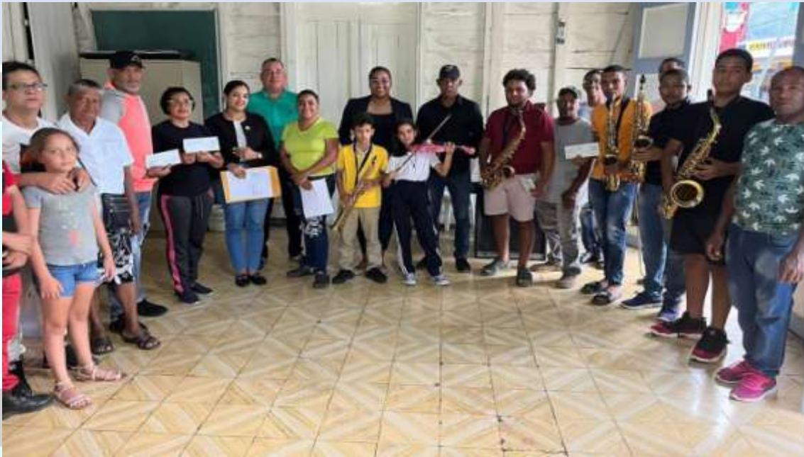
Apoyo Escuela De Música Don Juan Rosado