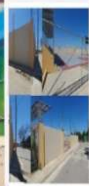
CONSTRUCCIÓN DE VERJA PERIMETRAL, CANCHA LA JOVA