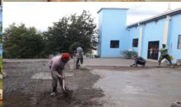
Construcción De Calzadas Y Piso, Parroquia Las Mercedes