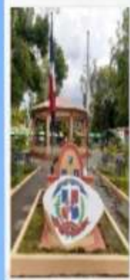
REMEDIACIÓN PIEDRA DEL PARQUE DON JUAN ROSADO