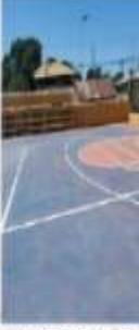
RECONSTRUCCIÓN CANCHA DEL TAMARINDO

CONOCE PARTE DE NUESTRA Tres años Transformando la Municipalidad