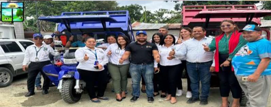
Compra de dos (2) Moto Volteos para la recolección de basura $580,000.00