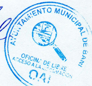
Ángela Pol, Enc. OAIM