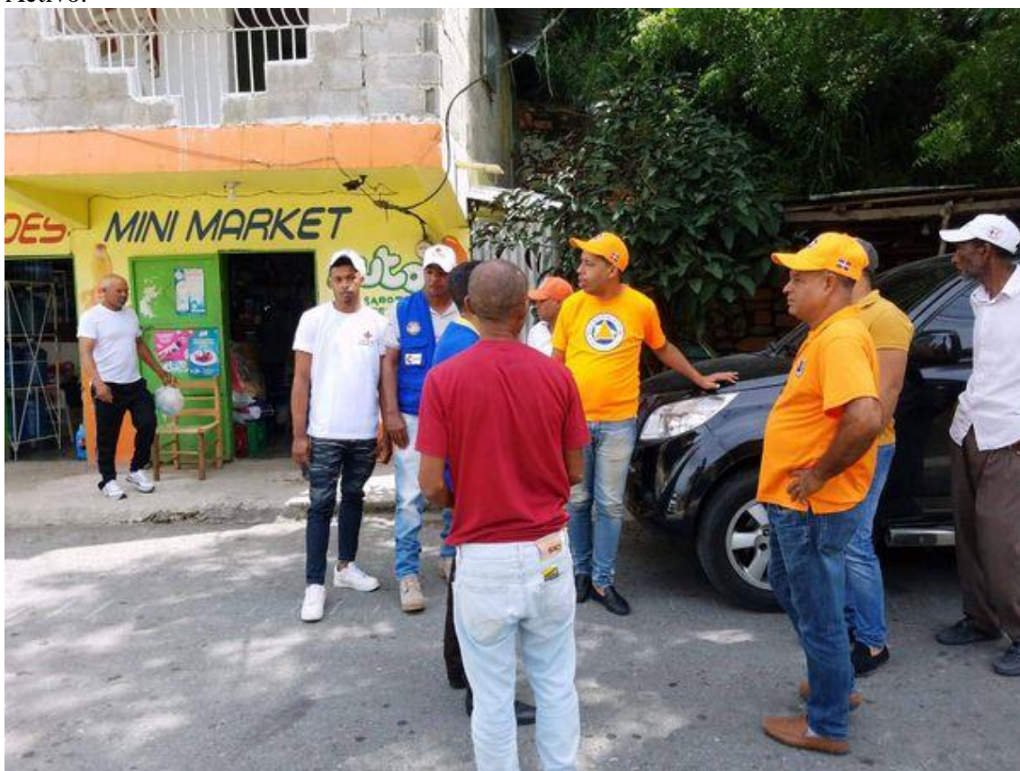
Operativo de prevención ante la llegada de FIONA, Comité de Emergencia Municipal Activo.