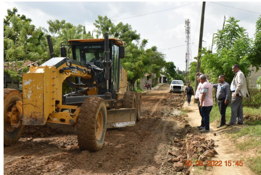
Mobile uploads Los Redimidos