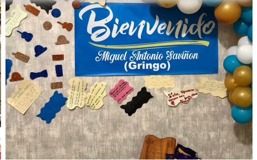
Mobile uploads Decoración de recibimiento