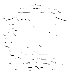
Lic. Darío Castillo Lugo Ministro de Administración Pública

Dada en la Ciudad de Santo Domingo de Guzmán, Distrito Nacional, Capital de la República Dominicana, a los veintidós (22) días del mes de junio del año dos mil veintidós (2022).