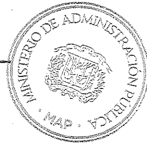
Darío Castillo Lugo Ministro de Administración Pública