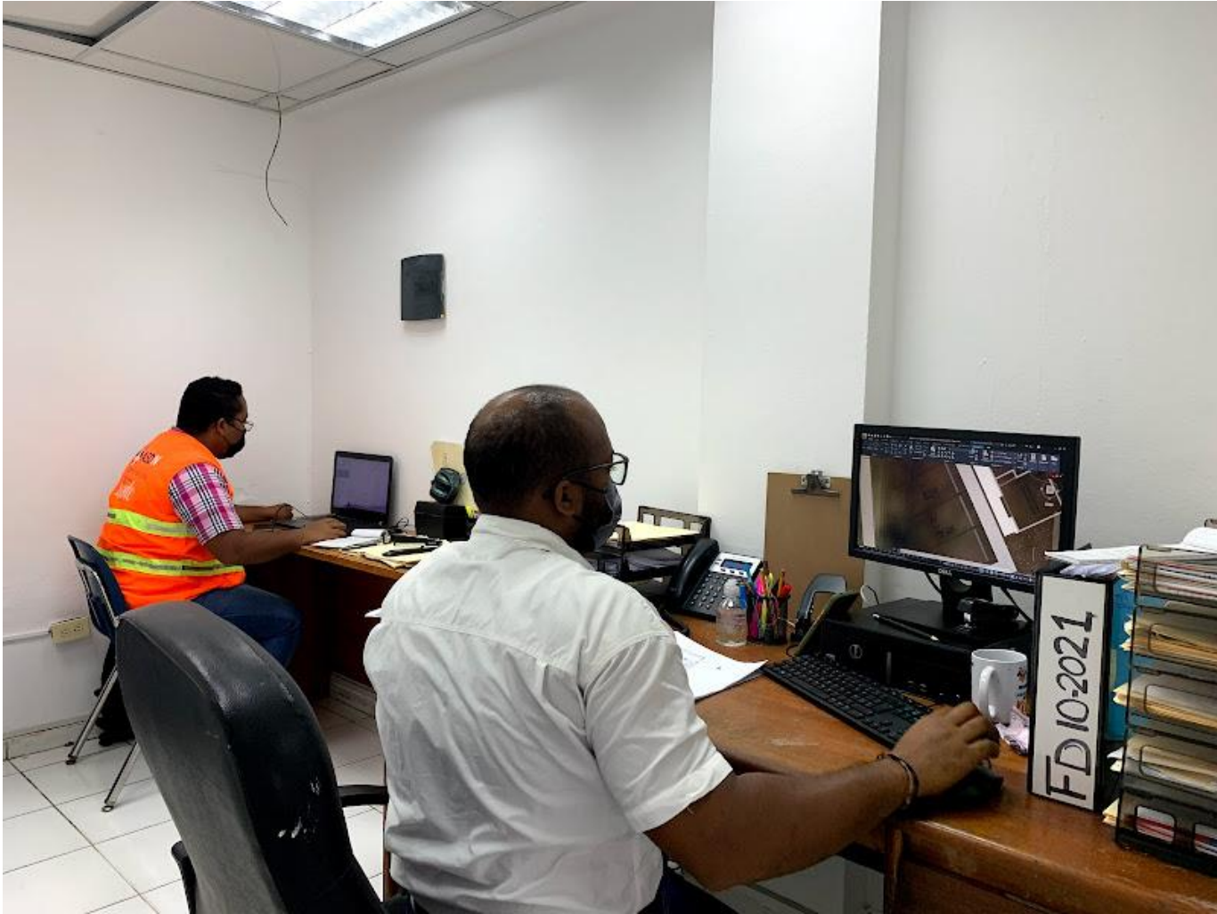
Movilidad y Transito sostenible