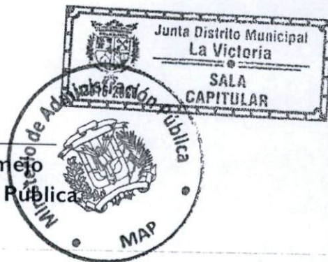
Lic. Ramón Ventura Camero Ministro de Administración Pública