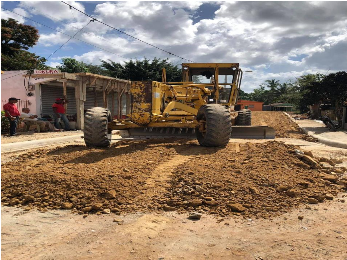
Mejoramiento de calles