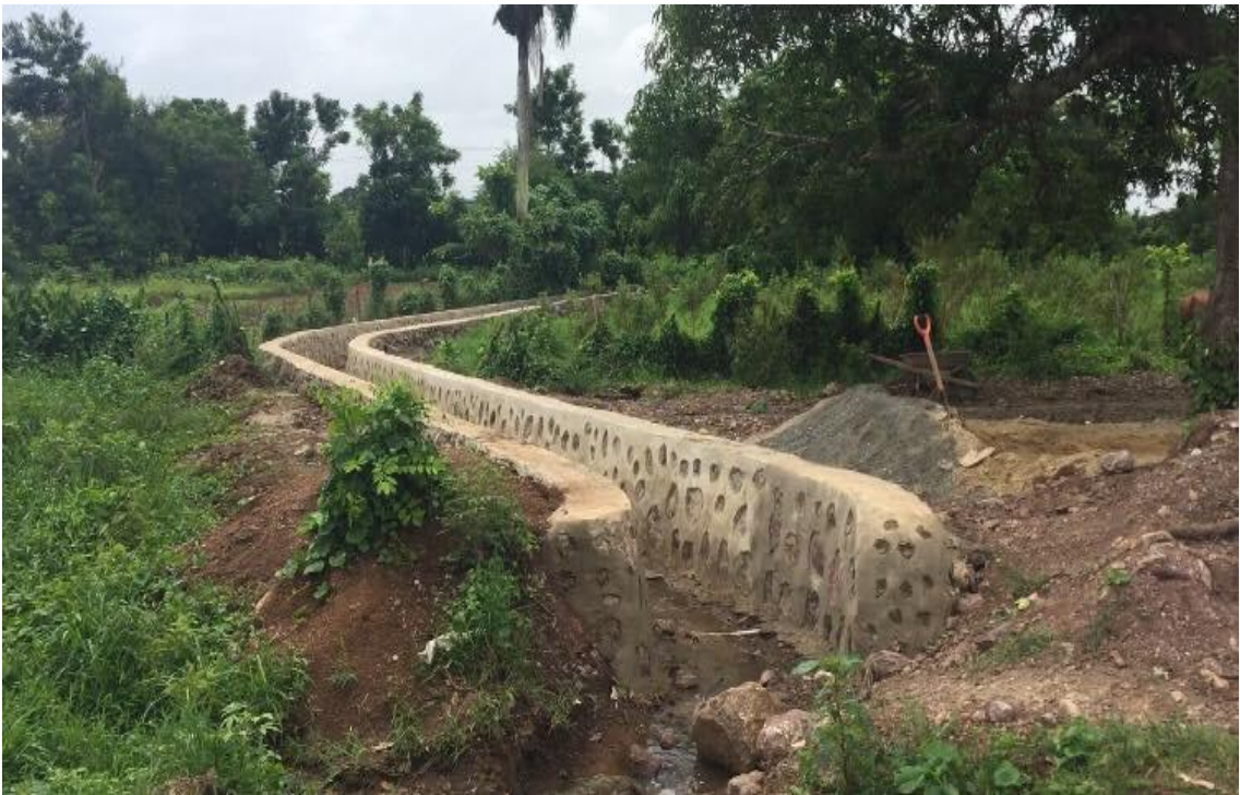
Encache de zanja