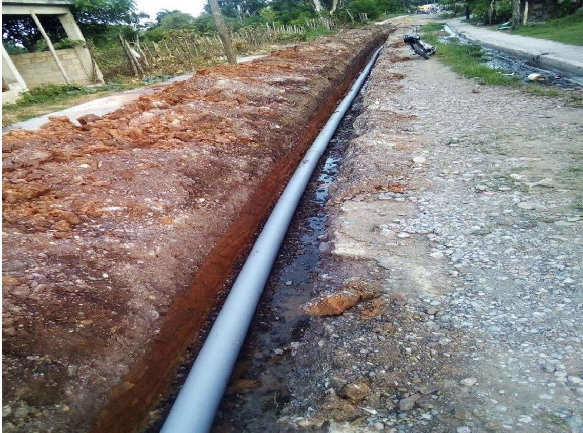
Construcción de Aceras