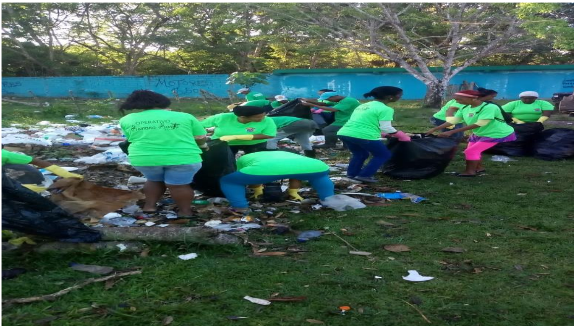
Limpieza rio comate