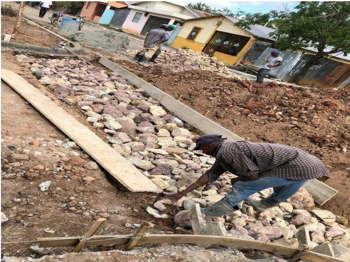
Construcción de aceras