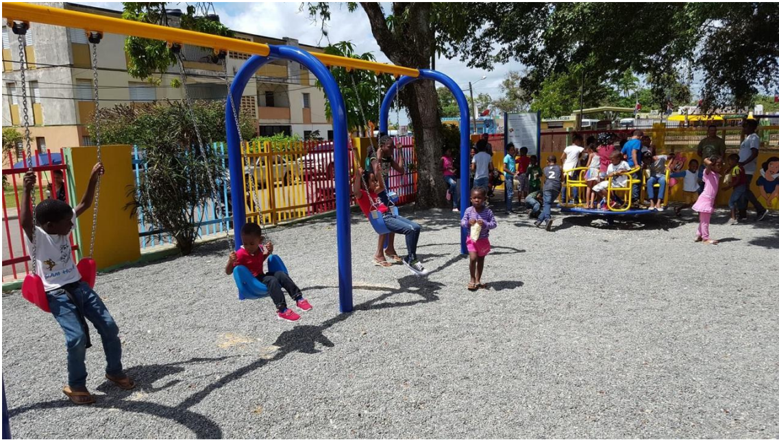
Niño en disfrutes de juegos