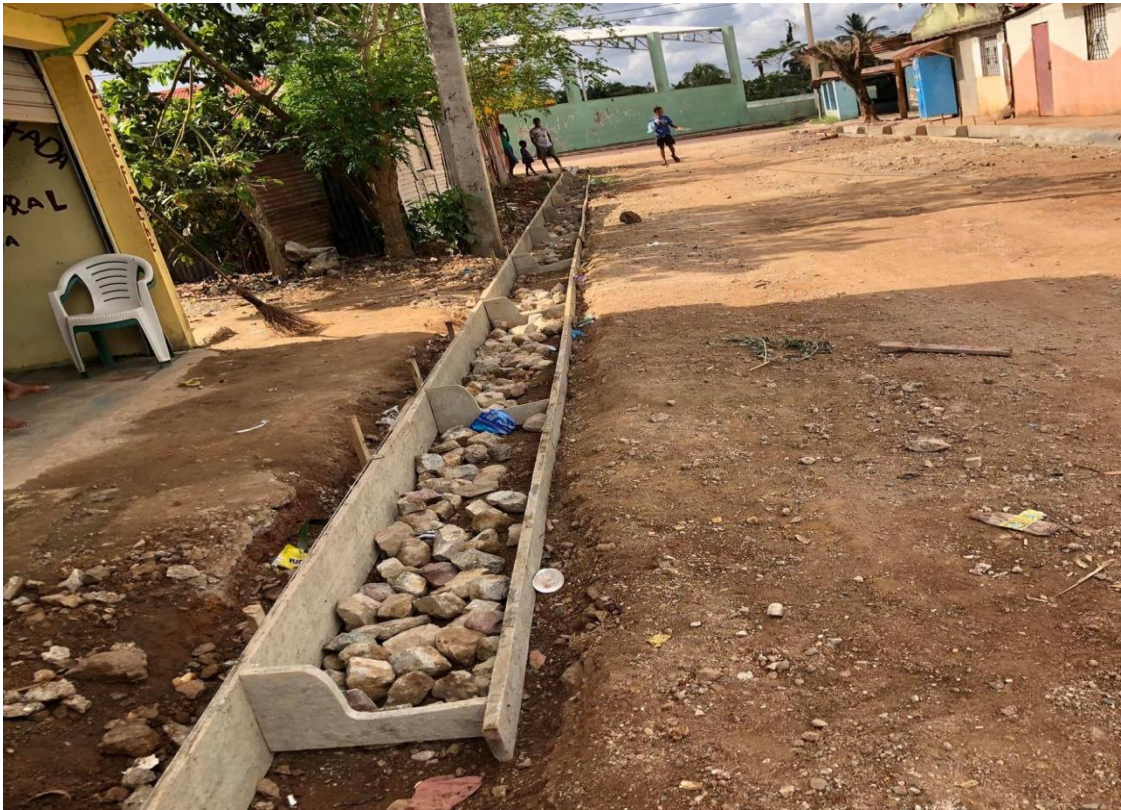
Construcción de contenes