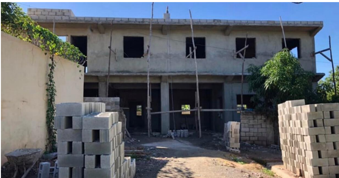
Nivel de avance del centro de capacitación