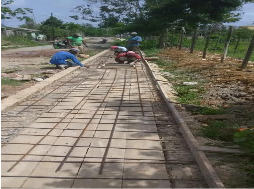
Instalación de tubos para Agua Potable