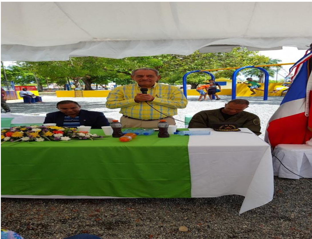
Inauguración del área de juego