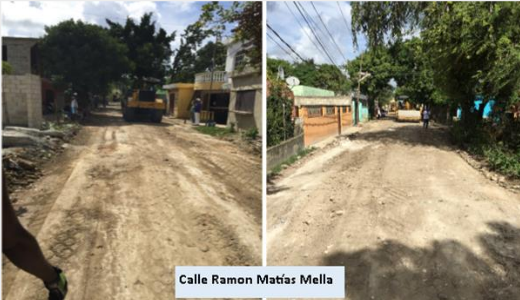
Calle Ramon Matías Mella

ACONDICIONAMIENTO DE CALLES CON CALICHE Y MATERIAL SIN CLASIFICAR