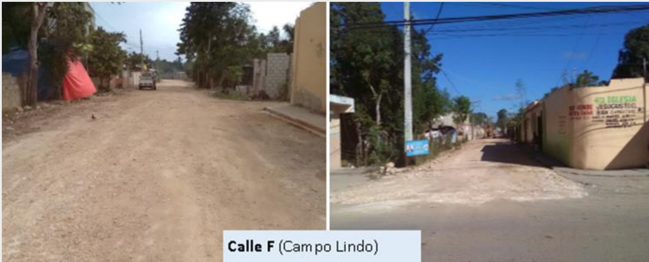
Calle F (Campo Lindo)