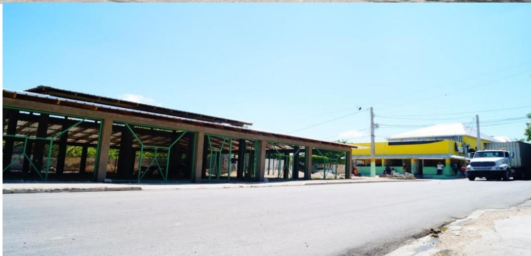
Construcción Plaza Buhonera.