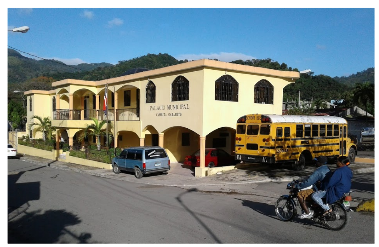
Edificio del Ayuntamiento de Cambita Garabitos