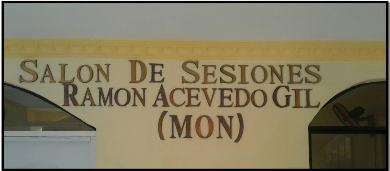
Salón de Sesiones Ramón Acevedo Gil, Sala Capitular del Ayuntamiento de Cambita Garabitos