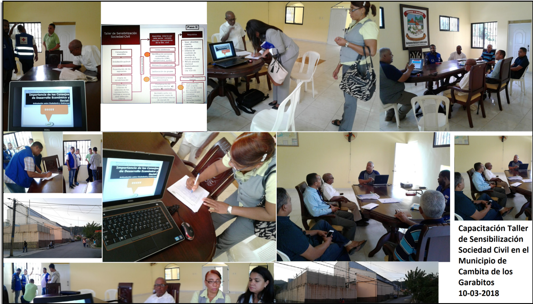
Capacitación Taller de Sensibilización Sociedad Civil en el Municipio de Cambita de los Garabitos 10-03-2018

En el Colage se observa a representantes de organismos de socorro, maestras, el técnico OMPP, representante de CONJUVECA, Representantes del sector Aguacatero (de exportación) Deportes , Cultura y Medio Ambiente de Cambita Garabitos, Además se observa parte del material Impartido y una panorámica de una Procesadora de Café INDUBÁN en esa localidad.