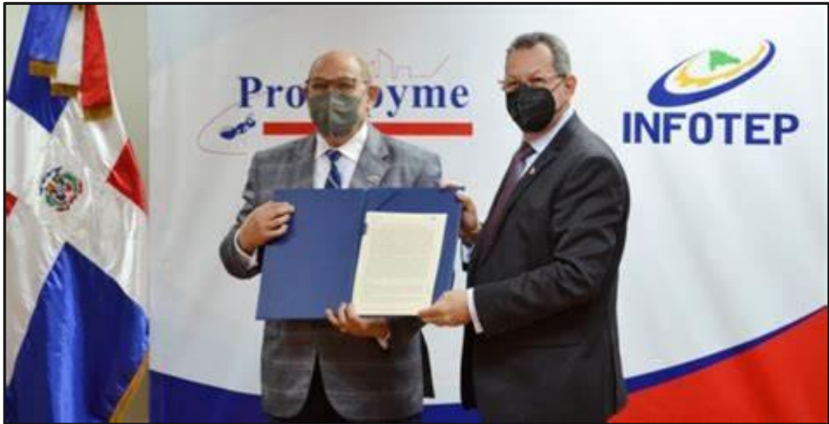
Evidencia #3 Evento de Consulta Vistas Públicas