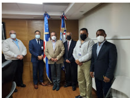
Fotografias Evidencias Reunion 17-08-2021 (3).jpg 234K