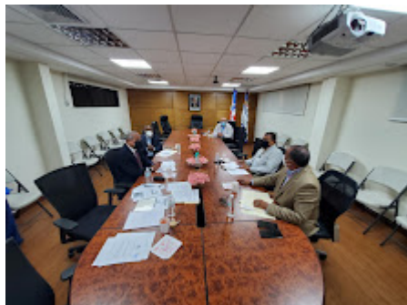
Fotografias Evidencias Reunion 17-08-2021 (1).jpg 258K