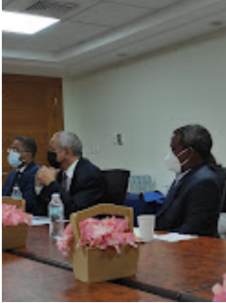
Fotografias Evidencias Reunion 17-08-2021 (5).jpg