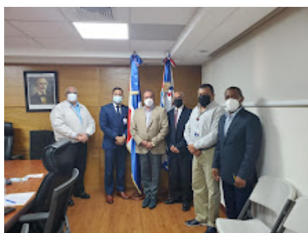
Fotografias Evidencias Reunion 17-08-2021 (2).jpg 214K