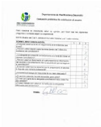
encuesta de satisfaccion conciliacion.jpg 261K