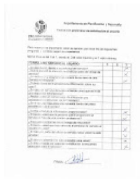
Reporte de tiempo de atencion servicio al usuario.JPG 96K

Correo de Ministerio de Administración Pública - Manual de procedimientos misionales Pro Consumidor