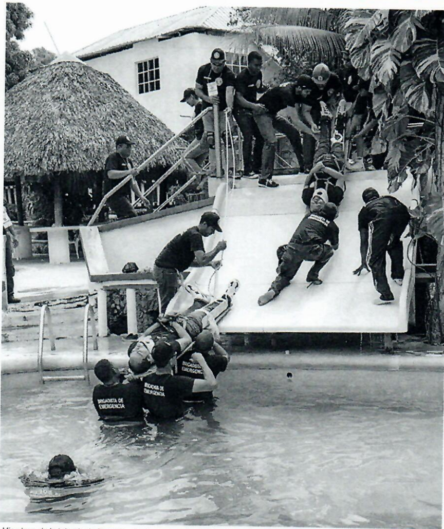
Miembros de la brigada de Rescate, simulando rescate real de víctimas.