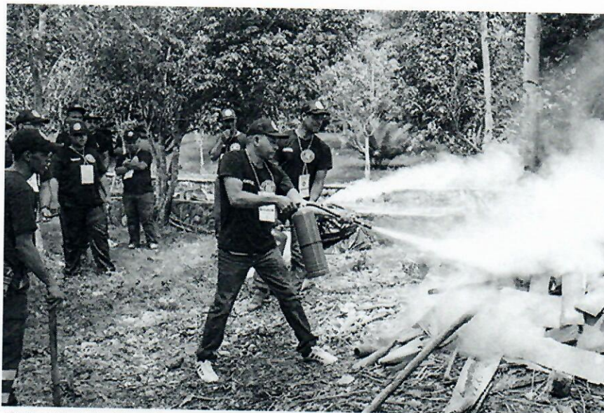
Práctica de combate de incendio.

Igualmente, fomentar en las brigadas del Ministerio de Hacienda la capacidad propia de respuesta ante emergencia y dotarlas de técnicas adecuadas.