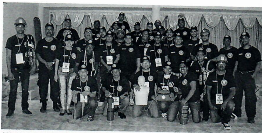
Integrantes de las brigadas de Primeros Auxilios, y la de Búsqueda y Rescate, con instructores.

El Ministerio de Hacienda ofreció un taller-campamento de capacitación titulado "Brigadas de Emergencia y Simulaciones de Respuesta a Eventos Catastróficos", dirigido a la formación teórica y práctica de los integrantes de las brigadas de Búsqueda y Rescate, y la de Primeros Auxilios, de esta institución.